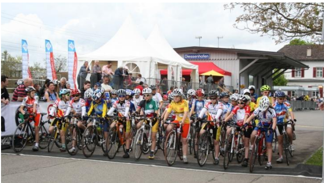
Bild: Start Schüler 2013