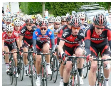
blaues Leadertricot für besten "Jungen"